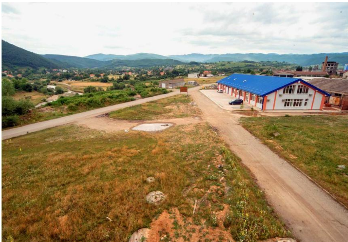
Slika 5: BZ "Rudeš"