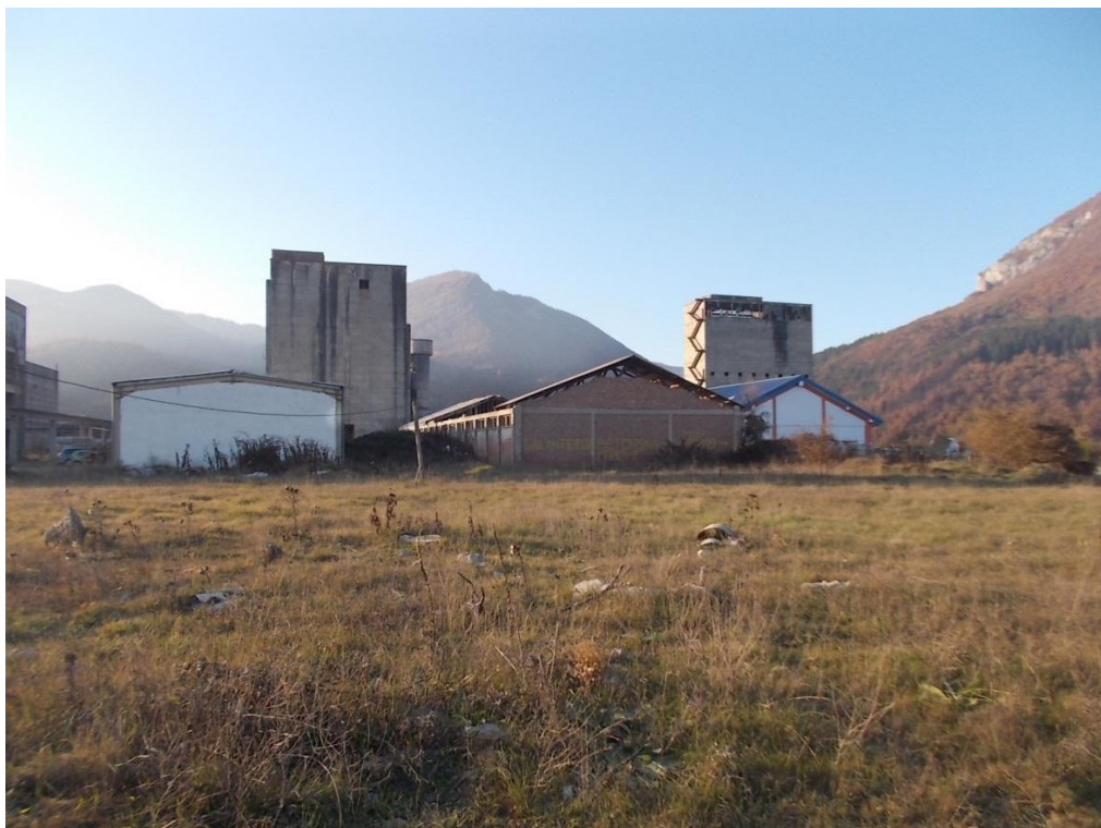
Slika 4: BZ "Rudeš"