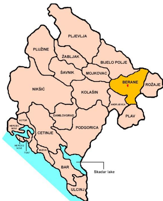
Slika 1. Položaj opštine

Povoljan geosaobraćajni položaj opštine Berane omogućava komplementaran razvoj za ostalim dijelom Crne Gore ali i sa pograničnim regionima Srbije i Kosova. Iz tih razloga, Prostorni plan Crne Gore do 2020.god. ovu opštinu zajedno sa Bijelim Poljem, Plavom i Andrijevicom definiše kao Polimsku razvojnu zonu, sa rijekom Lim kao "životnom linijom zone".