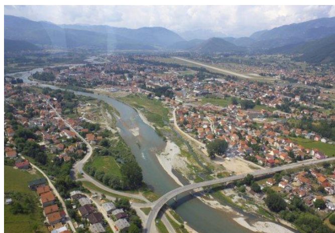
Slika 2. Panorama Berana

Administrativni centar opštine je Berane, grad koji je smješten u Beranskoj kotlini na obalama Lima. Iako je kroz svoju burnu istoriju ovaj grad mijenjao i ime i izgled uvek je imao važnu ulogu i predstavljao kulturni, obrazovni i privredni centar od šireg značaja.